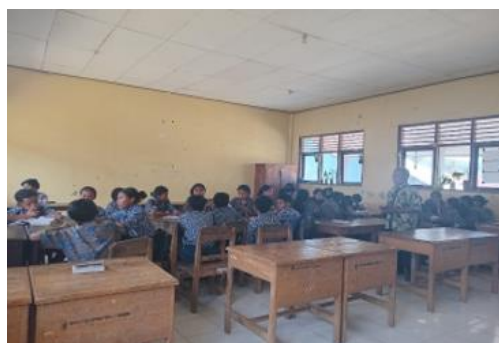
Gambar 3. Pelatihan Teknik Storytelling Interaktif

Pada awal sesi pelatihan, tim pengabdian menyampaikan konsep dasar storytelling interaktif yaitu bagaimana menyampaikan cerita melalui dialog, ekspresi wajah dan gerak tubuh yang ekspresif. Dalam sesi ini juga, siswa diperlihatkan contoh video pendek bagaimana narator profesional membawakan cerita rakyat lokal Timor dalam bentuk natoni (tutur adat Timor). Pendekatan pembelajaran ini menekankan pada beberapa aspek penting yaitu intonasi dan artikulasi, ekspresi wajah dan gestur tubuh, kontak mata narator dengan audiens serta kelihaihan dalam menggunakan beberapa property yang sesuai dengan narasi cerita.