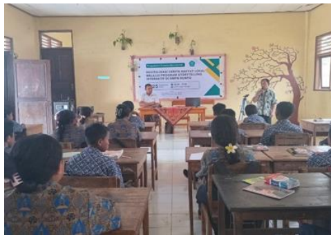
Gambar 2. Pengenalan Cerita Rakyat Lokal Legenda Bukit Fafinesu

Kegiatan ini diawali dengan sesi pengantar oleh tim pengabdian yang menjelaskan pengertian cerita rakyat dan jenis-jenisnya seperti fabel, mitos atau dongeng serta perannya dalam kehidupan bermasyarakat. Pada tahap ini, tim pengabdian memperkenalkan cerita rakyat lokal wilayah Timor dengan judul Legenda Bukit Fafinesu . Siswa diajak untuk memahami nilai moral dan budaya yang terkandung di dalam cerita rakyat tersebut.