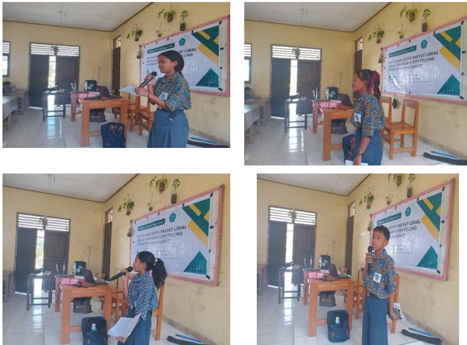
Gambar 4. Siswa menampilkan cerita Rakyat dengan storytelling interaktif

Setelah memahami Teknik dasar, siswa dilatih untuk berimprovisasi dalam membawakan cerita mereka. Siswa diminta untuk mengembangkan gaya bercerita masing-masing. Dalam sesi ini, siswa juga dilatih untuk berinteraksi dengan penonton. Sesi ini membuat suasana menjadi lebih rileks dan santai sehingga mengurangi gangguan kecemasan berbicara pada siswa. Setiap siswa yang tampil juga selalu diberikan pujian dan apresiasi oleh tim pengabdian untuk meningkatkan rasa percaya diri mereka.