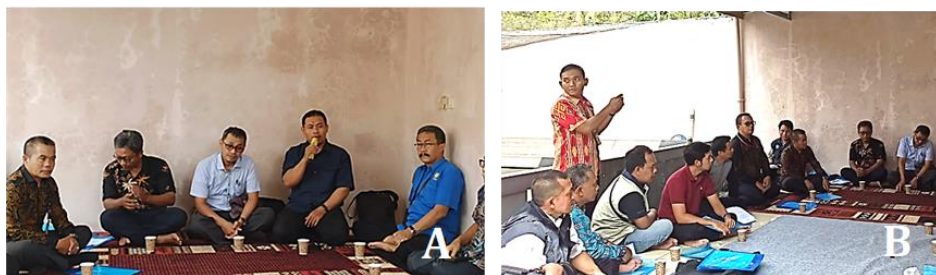
Gambar 1. Dokumentasi Pelaksanaan Pelatihan A. Penyampaian Materi; B. Sebagian Peserta Pelatihan

Pelatihan klasikal juga mendorong perubahan sikap dan motivasi pembudidaya melalui interaksi sosial yang memperkuat rasa percaya diri dan kemauan untuk mandiri dalam produksi benih ikan. Hal ini sejalan dengan hasil studi Kusumadinata yang menekankan pentingnya strategi komunikasi interaktif dalam pemberdayaan pembudidaya ikan [27].